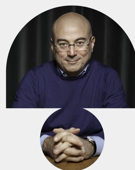
ALDO CAZZULLO MER. 22 DIC. 2021 H: 19:00