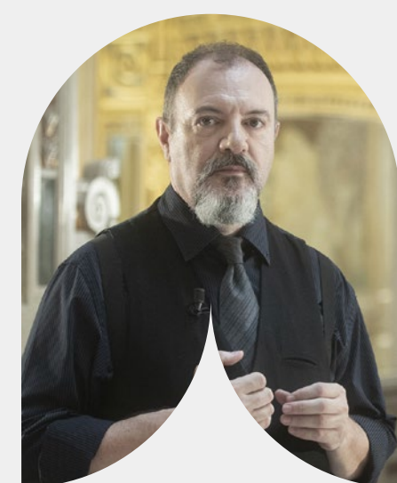
CARLO LUCARELLI VEN. 28 GEN. 2022 H: 19:00