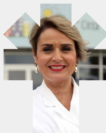
ANTONELLA VIOLA SAB. 13 NOV. 2021 H: 18:30