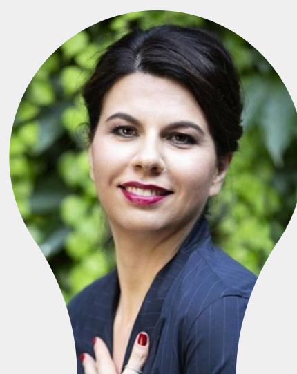
GEPPI CUCCIARI VEN. 3 DIC. 2021 H: 19:00