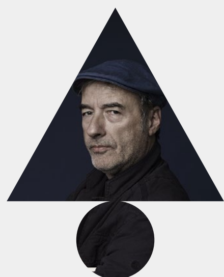
DAVID RIONDINO VEN. 4 FEB. 2022 H: 19:00