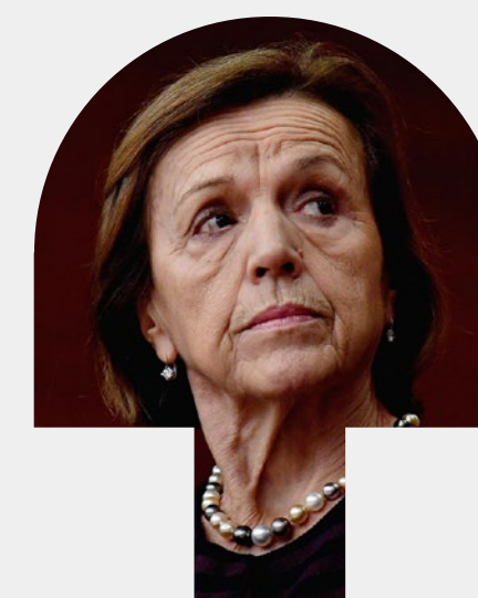
ELSA FORNERO VEN. 10 DIC. 2021 H: 19:00