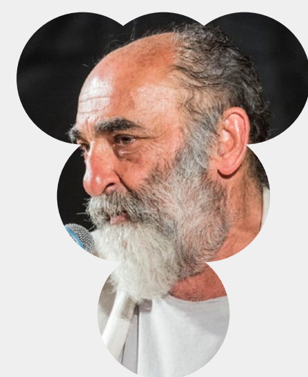
ALESSANDRO HABER SAB. 11 DIC. 2021 H: 18:30