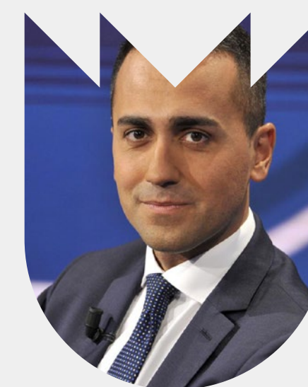
LUIGI DI MAIO VEN. 21 GEN. 2022 H: 19:00