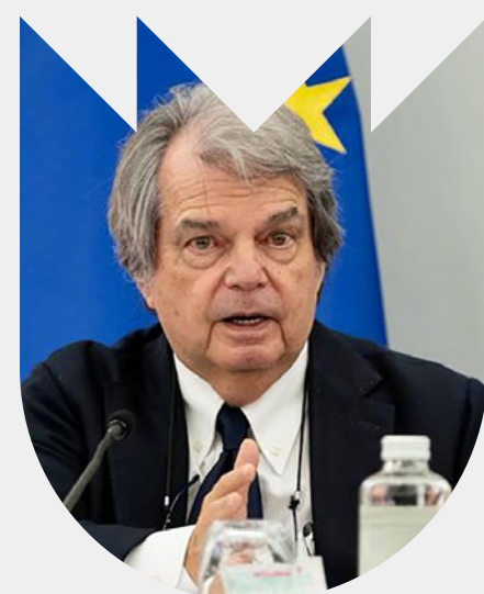
RENATO BRUNETTA SAB. 30 OTT. 2021 H: 18:30