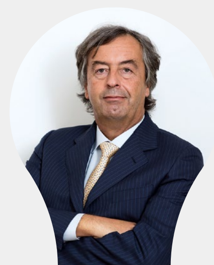
ROBERTO BURIONI VEN. 11 MAR. 2022 H: 19:00