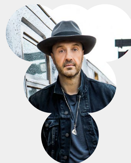
JOE BASTIANICH VEN. 8 APRILE. 2022 H: 19:00