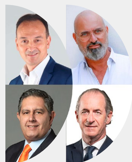
ALBERTO CIRIO STEFANO BONACCINI GIOVANNI TOTI LUCA ZAIA VEN. 26 NOV. 2021 H: 19:00